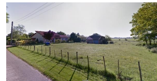
2 - Une inscription en continuité de...