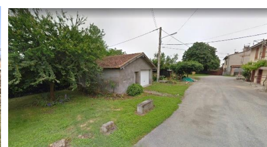
3 - Le « Patus », espace de vie partagé