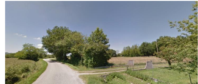
2 - Perspective sur la zone depuis la RD30