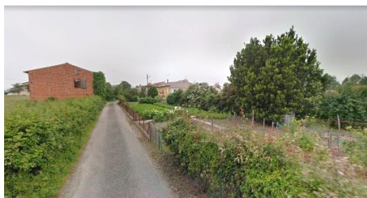
1- Entrée du hameau avec les jardins