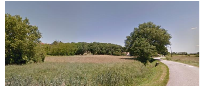
1 - Perspective sur la partie sud-est de la zone depuis la RD30