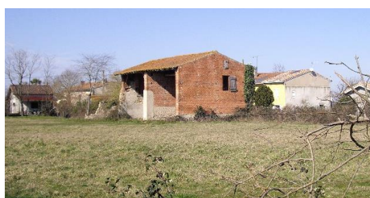
2 - La grange