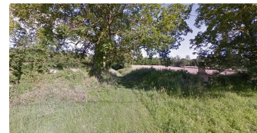
1 - Liaison douce vers le village