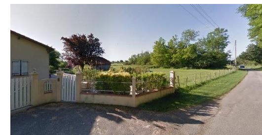
3 -... l'environnement bâti existant